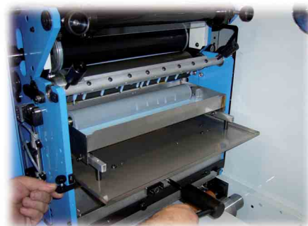
Section priming. Flexo coating section.