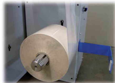
Section débobinage. Unwinding section.