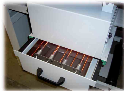
Cassette infra-rouge. Infrared drying unit.