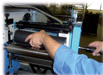
Cylindre manchon teintage. Sleeve coating cylinder.